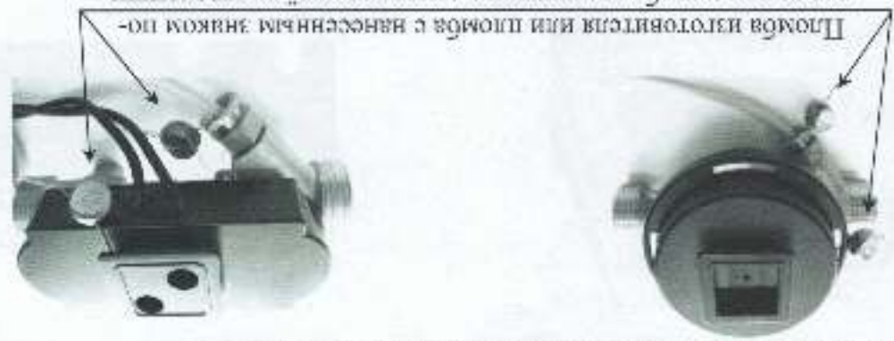
а) схема пломбировки термощетяков с сопротивлением на крыльчатках расходомера б) схема пломбировки термощетяков с сопротивлением на ультразвуковых датчиках