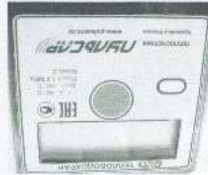
а) вид сверху

Маркировка вычислителей теплосчетчиков модификаций "Пульсар" Т, "Пульсар" У и "Пульсар" УТ приведена на рисунке 4.