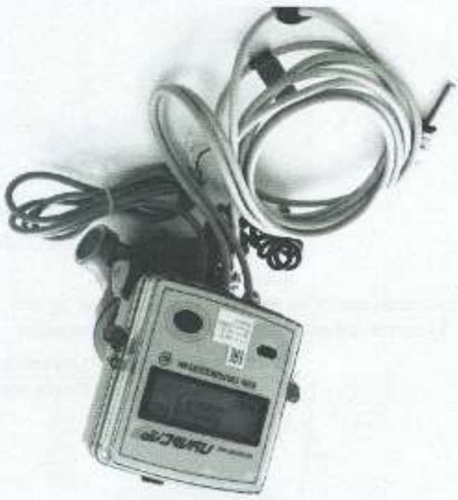
а) модифицированный "Лузсар" К