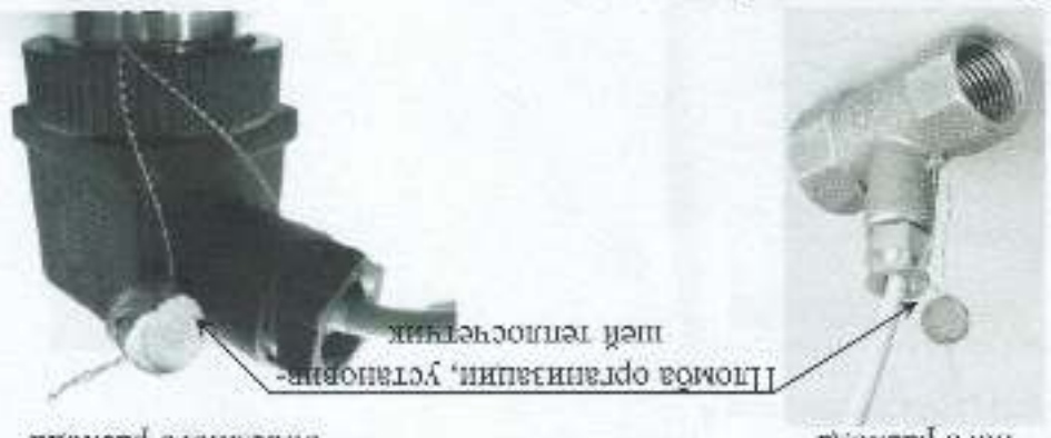
в) схема пломбировки термощетяков с сопротивлением на трубопроводе г) схема пломбировки датчиков давления