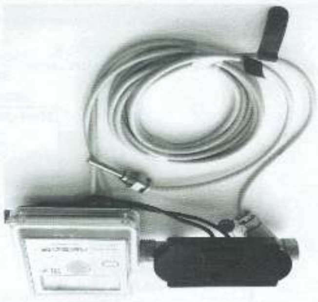
в) модифицированный "Лузсар" V