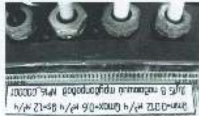
б) вид снизу

Рисунок 3 – Маркировка вычислителей теплосчетчиков модификаций "Пульсар" К