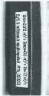
б) вид справа

Рисунок 4 – Маркировка вычислителей теплосчетчиков модификаций "Пульсар" Т, "Пульсар" У и "Пульсар" УТ