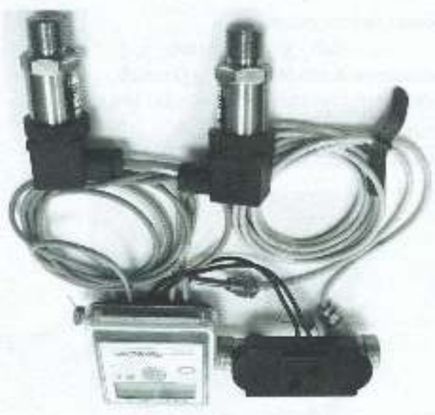
д) модифицированный "Лузсар" VU