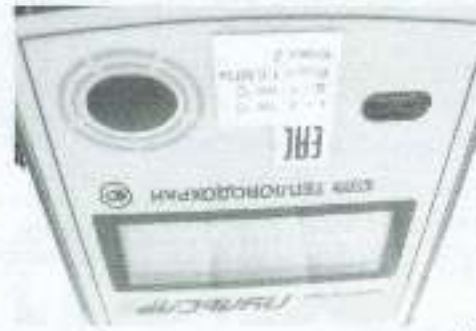
а) вид сверху

Маркировка вычислителей теплосчетчиков модификаций "Пульсар" К приведена на рисунке 3.