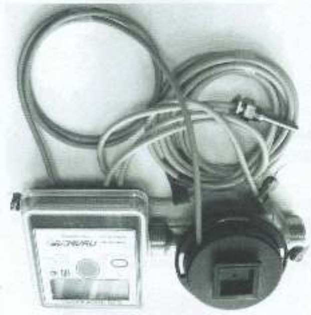
б) модифицированный "Лузсар" T